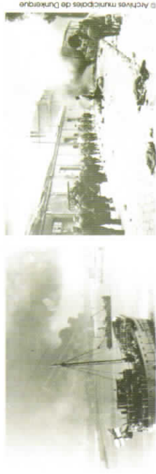
Dunkerque après les bombardements / Dunkirk after the bombing

Dunkerque et son port seront entièrement détruits.